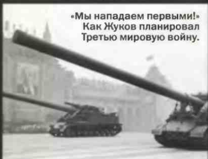
«Мы нападаем первыми!» Как Жуков планировал Третью мировую войну.