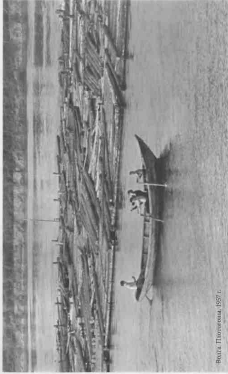
Волга. Плотовщики. 1957 г.