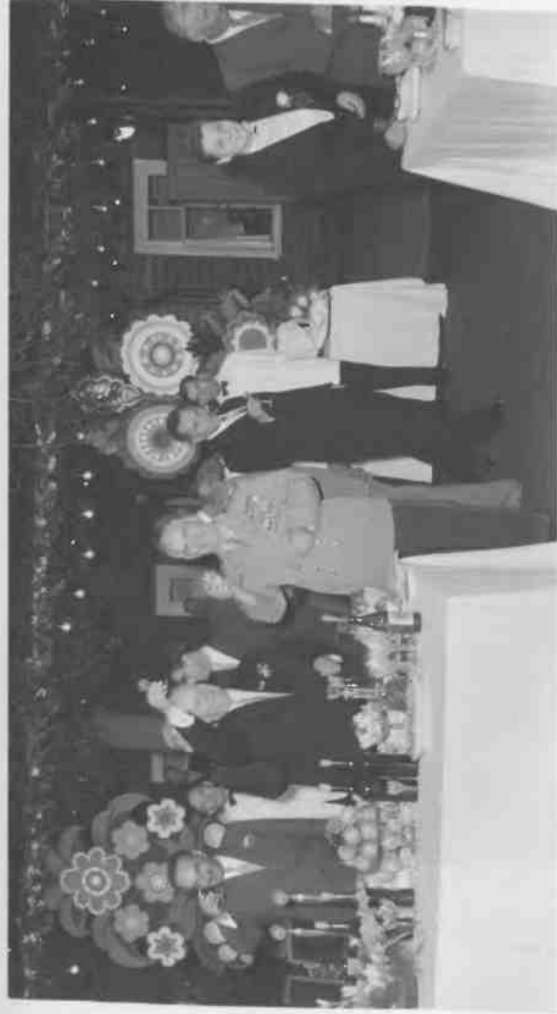
Вожди Советского Союза на встрече с участниками Московского международного фестиваля молодежи и студентов. В первом ряду слева направо: председатель Президиума Верховного Совета Анастас Микоян, первый секретарь ЦК КПСС Никита Хрущёв, министр обороны Георгий Жуков, министр культуры Екатерина Фурцева (Москва, конец июля 1957 г.).