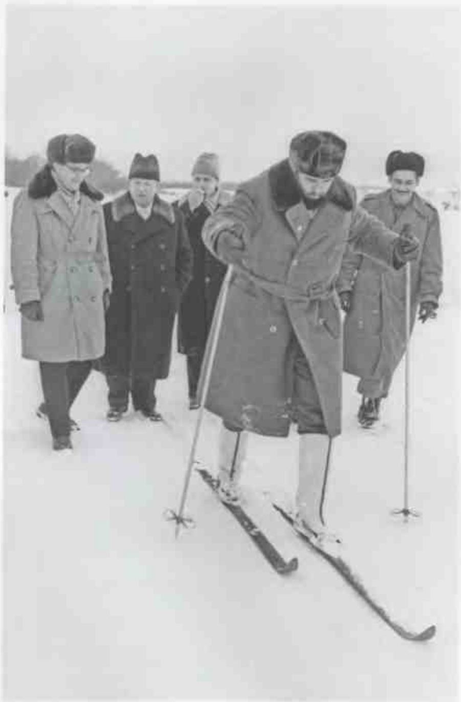
Лидер кубинской революции Фидель Кастро в сопровождении Никиты Хрущёва (второй слева) учится ходить на лыжах во время визита в Советский Союз (1964 г.).