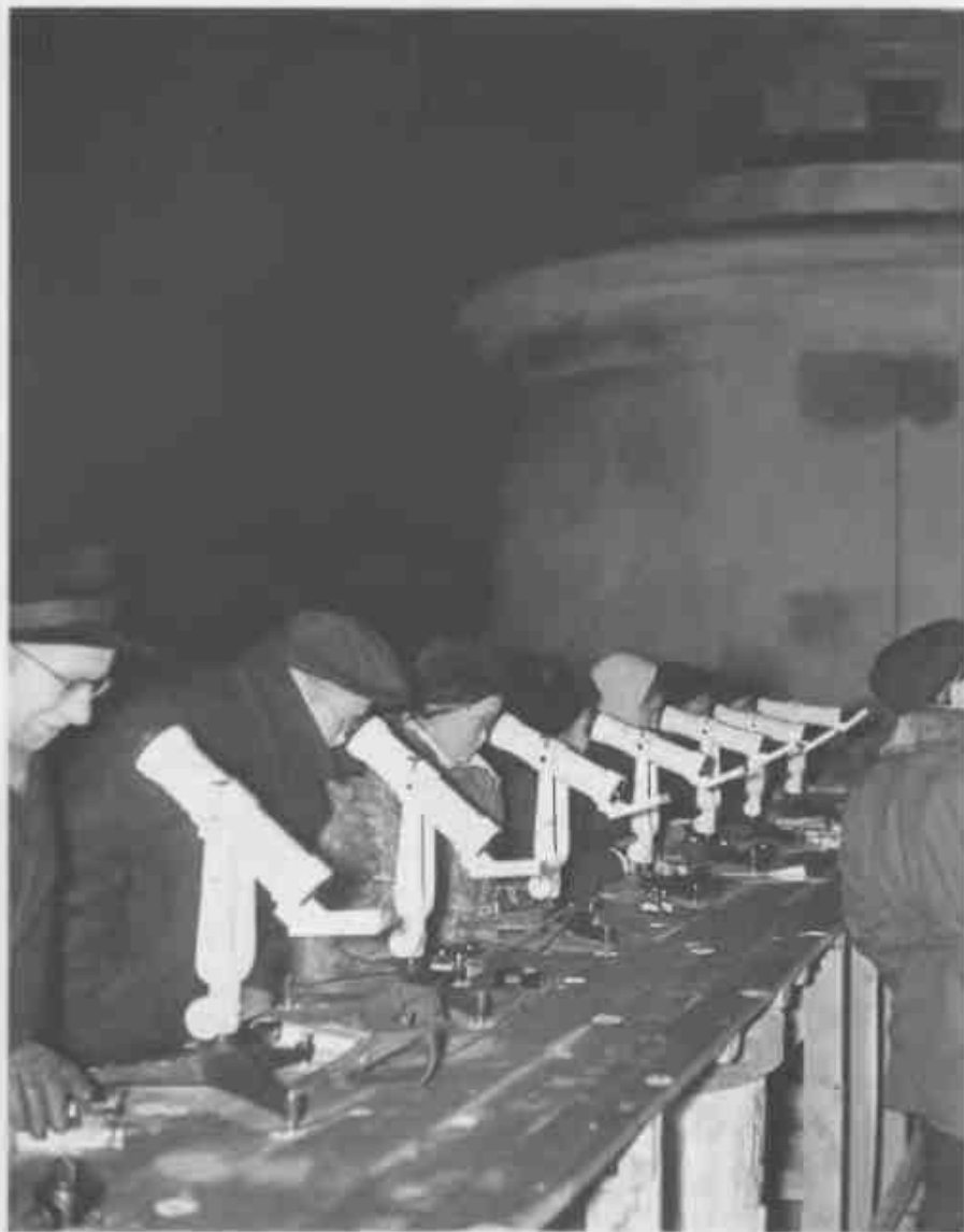
Сотрудники московского планетария наблюдают прохождение первого искусственного спутника Земли над Москвой 12 октября 1957 года.

Но Жуков разоблачил сам себя. Никто ему не возразил, никто не задал ему встречный вопрос. Потому, что все были смертельно запуганы. Потому, что все было ясно и без вопросов.