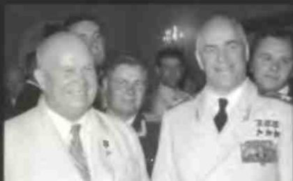
Хрущёв и Жуков: двоевластие перед решающей схваткой за власть.