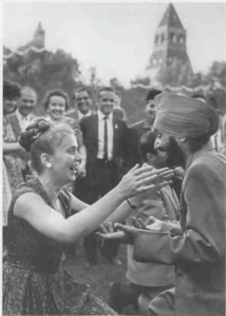
6-й Всемирный фестиваль молодежи и студентов в Москве. Встреча гостей из Индии (1 августа 1957 года).