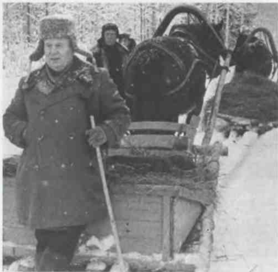
↑ Никита Хрущёв на охоте (Подмосковье, 13 января 1958 г.).

➤ Вожди Советского Союза на охоте (с посохом в руке стоит Никита Хрущёв). Они только что затравили дикого кабана. Честь добычи этого трофея принадлежала Брежневу, который, по свидетельству фотографа, очень гордился тем, что сделал меткий выстрел (1960 г.).