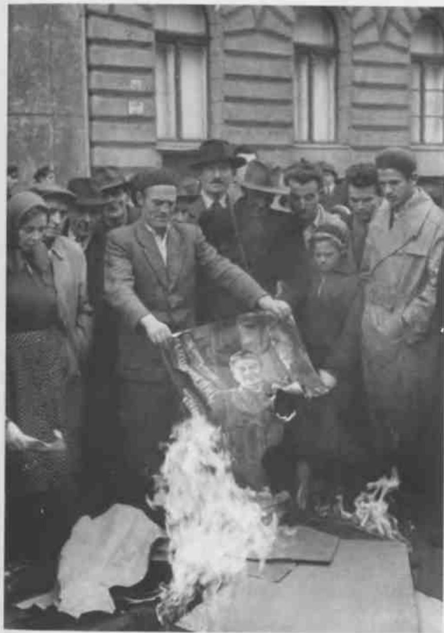
Жители Будапешта жгут портреты Сталина (начало ноября 1956 г.). Восстание в Венгрии началось 23 октября 1956 года с демонстрации студентов в Будапеште, а причиной демонстрации, прямой или косвенной, был XX съезд КПСС, на котором Никита Хрущёв, глава всех коммунистов планеты, объявил Сталина преступником и кровавым тираном. Этой речью Хрущёв нанес смертельный удар международному коммунистическому движению.

Оба орудия имели врожденные пороки. Прежде всего — габариты: длина больше 20 метров, высота — 5,7 метра. Как им ходить по улицам городов, не обрывая электрические провода? Как втиснуться под мост, нависающий над дорогой, как пройти по другому мосту, не провалившись?