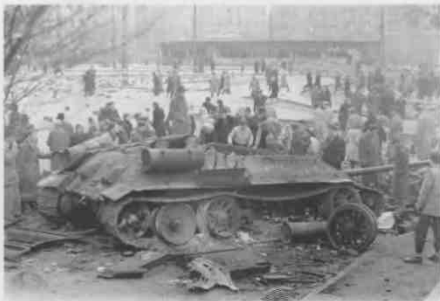
↑ Танк Т-34 с сорванной башней; вероятно, башня сорвана вследствие взрыва боекомплекта (Будапешт, конец октября – начало ноября 1956 г.).