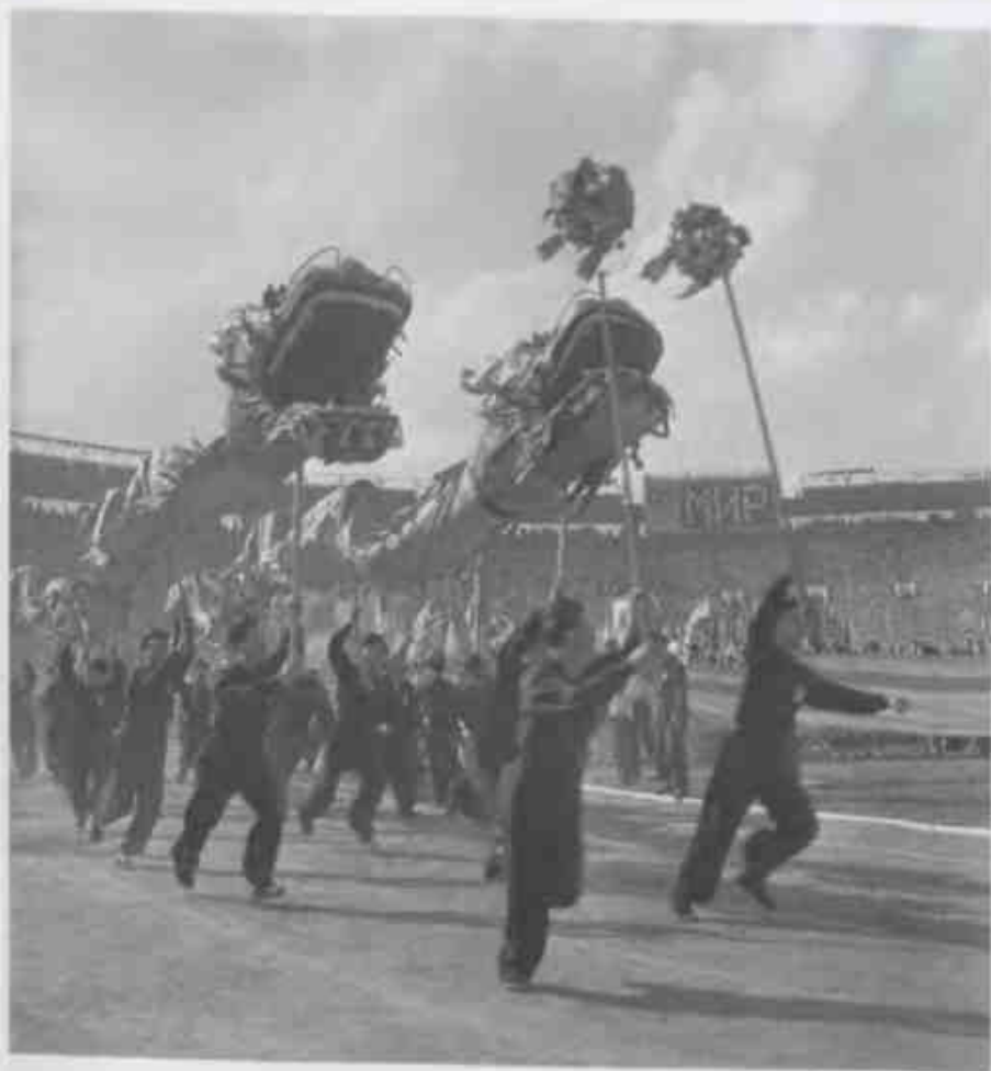
Торжественное открытие 6-го всемирного фестиваля молодежи и студентов в Москве (Центральный стадион имени Ленина в Лужниках, 28 июля 1957 г.). Китайская делегация исполняет танец с драконами.