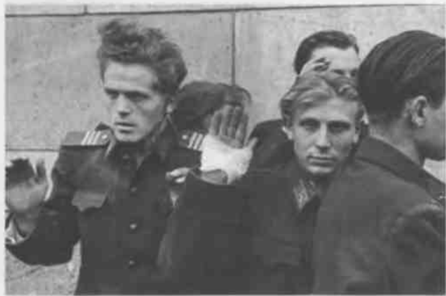
↓ Молодые сотрудники министерства госбезопасности Венгрии, арестованные восставшими жителями Будапешта (31 октября 1956 г.).