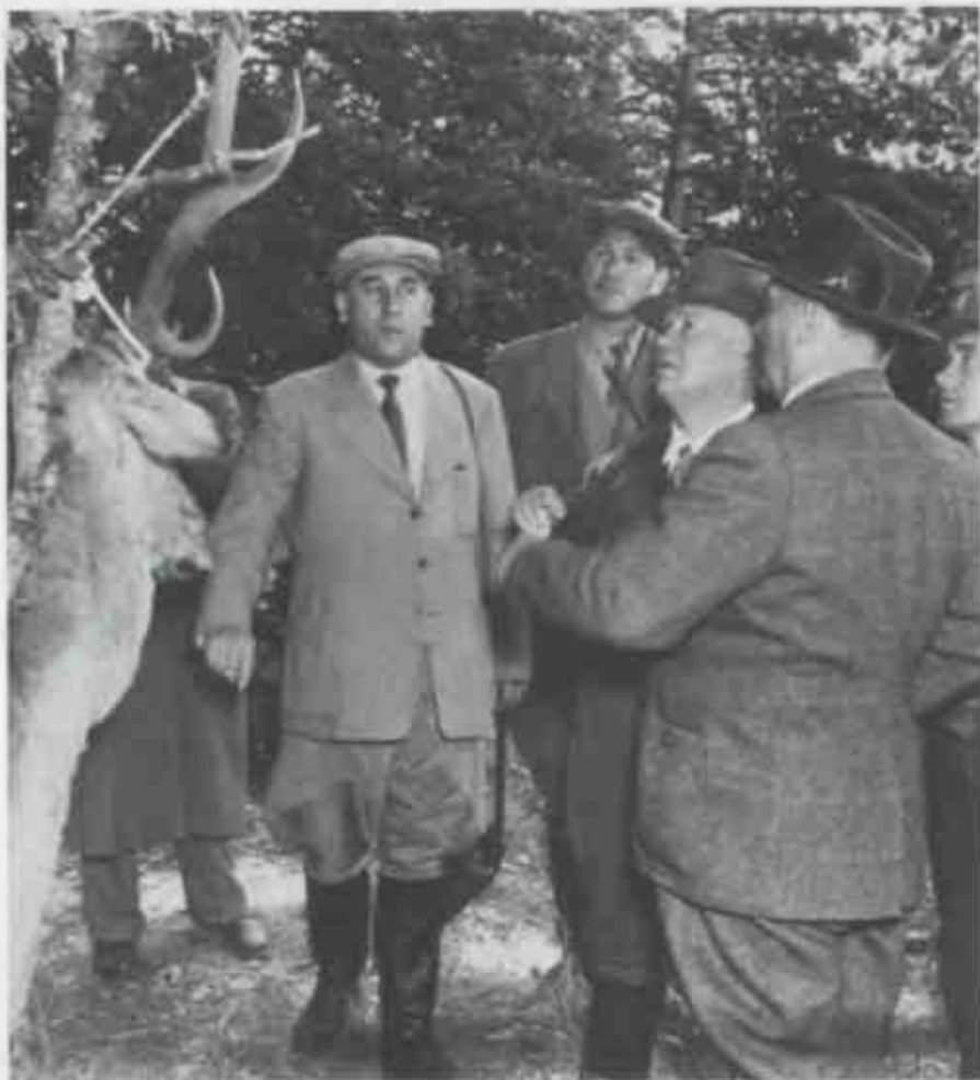
Никита Хрущёв (в центре) и президент Югославии маршал Иосип Броз Тито (справа, стоит спиной) осматривают охотничий трофей (1956 г.). Несмотря на восстановление при Хрущёве советско-югославских отношений, Союз коммунистов Югославии во главе с Тито и успешно противостоял идеологическому и политическому давлению СССР и отстаивал собственную модель развития социалистического общества, хотя Тито одобрил вторжение советских войск в Венгрию в 1956 году.