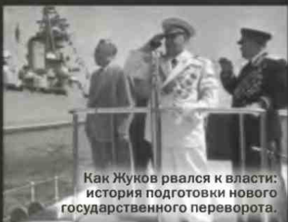
Как Жуков рвался к власти: история подготовки нового государственного переворота.