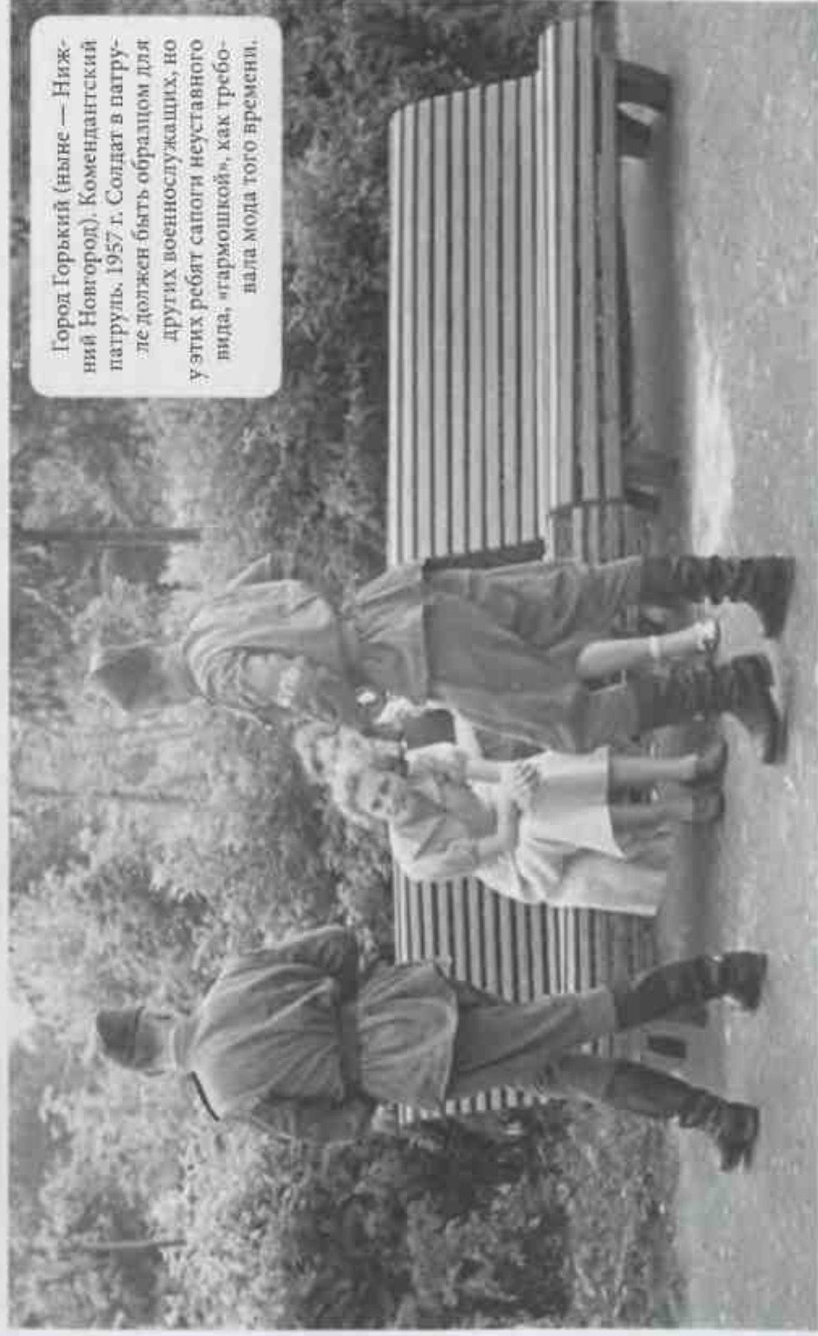
Город Горький (ныне — Нижний Новгород). Комендантский патруль. 1957 г. Солдат в патруле должен быть образцом для других военнослужащих, но у этих ребят сапоги неуставного вида, «гармошкой», как требовала мода того времени.