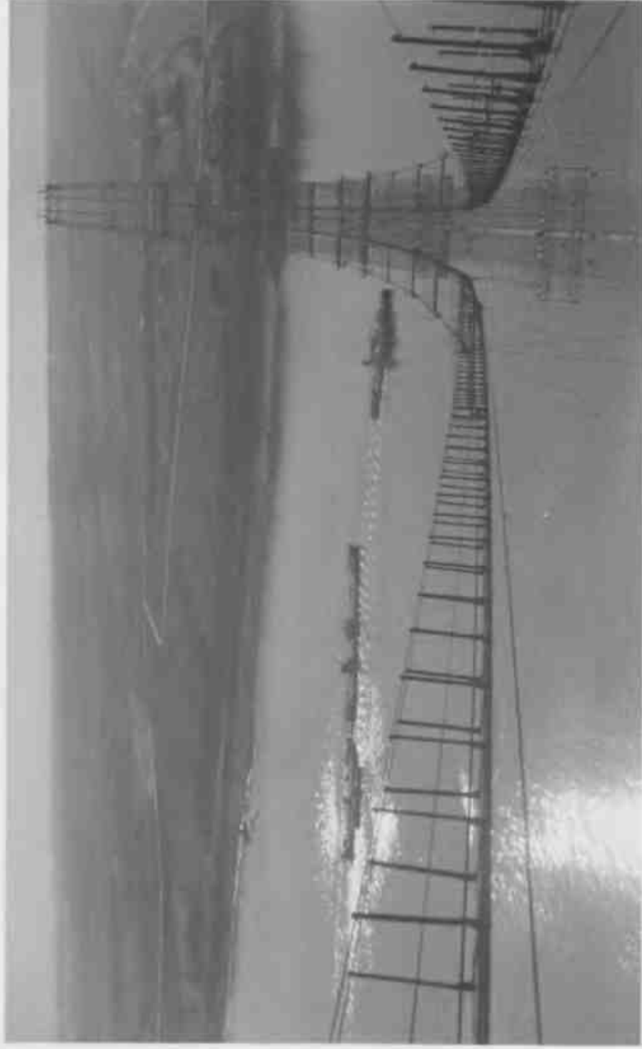
рис. 2 — стр. 8 рис. 2 — стр. 9

↑ Канатная дорога через Волгу в районе строительства Сталинградской (ныне — Волжской) гидроэлектростанции (1956 г.).