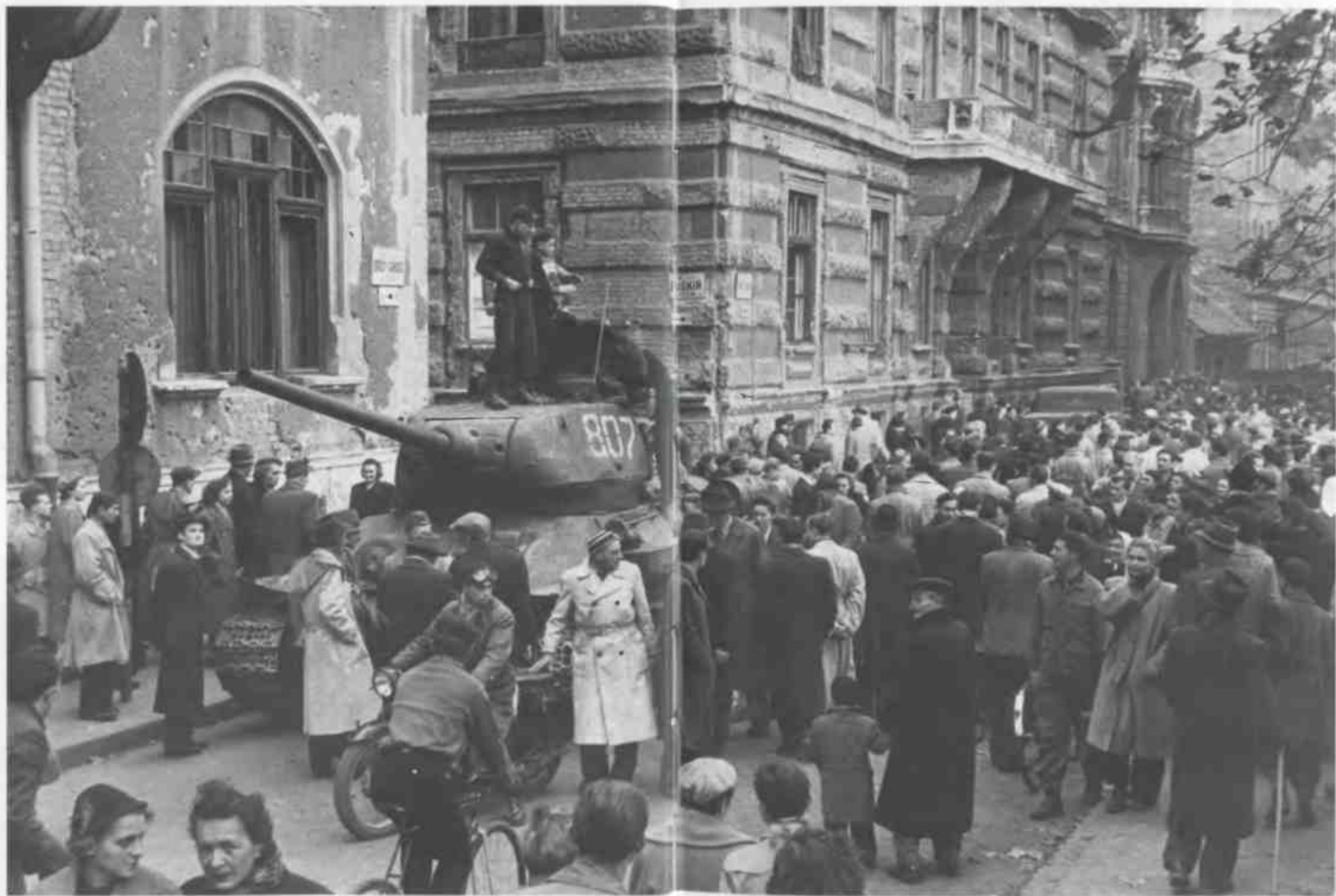
Жители Будапешта окружили советский танк Т-34-85 (конец октября 1956 г.). Советские товарищи, которых никто (пока) не просил вмешиваться во внутренние дела суверенного государства, были встречены, мягко говоря, без энтузиазма.