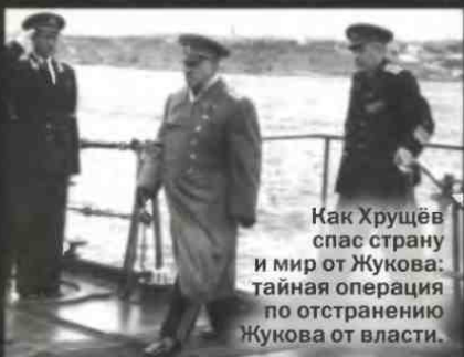
Как Хрущёв спас страну и мир от Жукова: тайная операция по отстранению Жукова от власти.

«Облом» — новая книга выдающегося историка, писателя и военного аналитика Виктора Суворова, вторая часть трилогии «Хроника Великого десятилетия», грандиозная историческая реконструкция событий 1956–1957 годов, когда Никита Хрущёв при поддержке маршала Жукова отстранил от руководства Советским Союзом бывших ближайших соратников Сталина, а Жуков тайно готовил военный переворот с целью смещения Хрущёва и установления единоличной власти в стране.