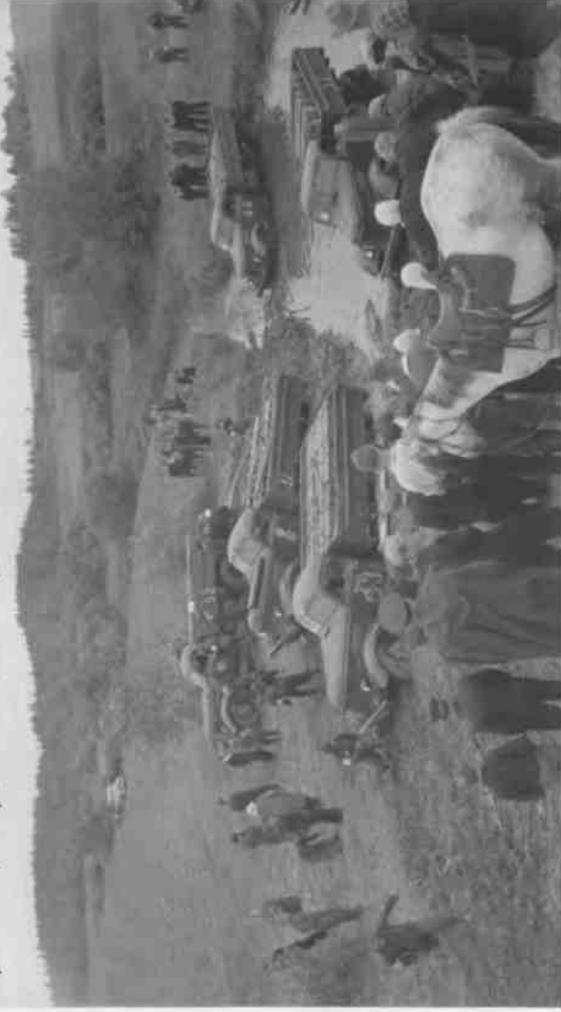
Соревнования по автокроссу в классе грузовых автомобилей на первенство СССР. Преодоление водной преграды близ деревни Юрки (Ленинградская область, июнь 1956 г.).