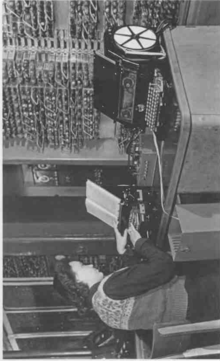
окт. 2 - стр. 10 окт. 2 - стр. 11

↑ Оператор набирает на перфораторе английский текст для ввода в одну из первых советских электронно-вычислительных машин БЭСМ-1 (Большая электронно-счетная машина) в Институте точной механики и вычислительной техники АН СССР (1956 г.). Машина была построена на электронных лампах (5 тысяч ламп) под руководством С. А. Лебедева, имела быстродействие от 8 до 10 тысяч операций в секунду и использовалась, в частности, для вычисления орбит планет и малых тел Солнечной системы и переводов с английского языка на русский. В октябре 1953 года БЭСМ-1 была самой быстродействующей ЭВМ в Европе, уступая по быстродействию и объему памяти лишь американской IBM 701.