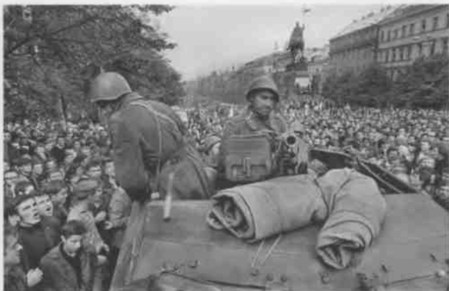
↑ Советский бронетранспортер БТР-152 заблокирован жителями Будапешта на одной из центральных улиц города (конец октября – начало ноября 1956 г.). Опыт боевого применения бронетранспортеров в Венгрии показал, что вместо открытого кузова машины такого типа следует выпускать с бронированной крышей.