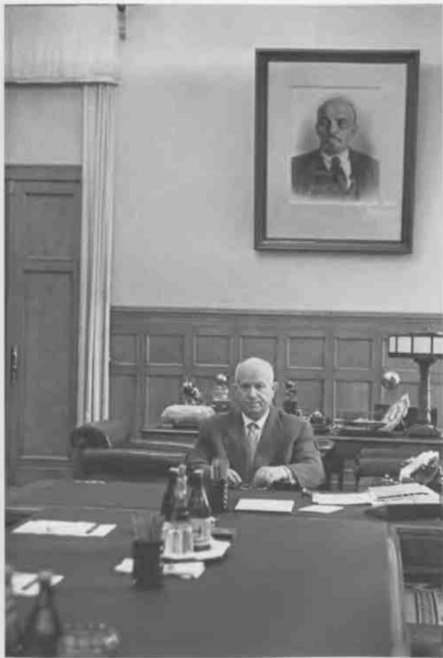
Никита Хрущёв в своем рабочем кабинете в Кремле (начало 1960-х годов).