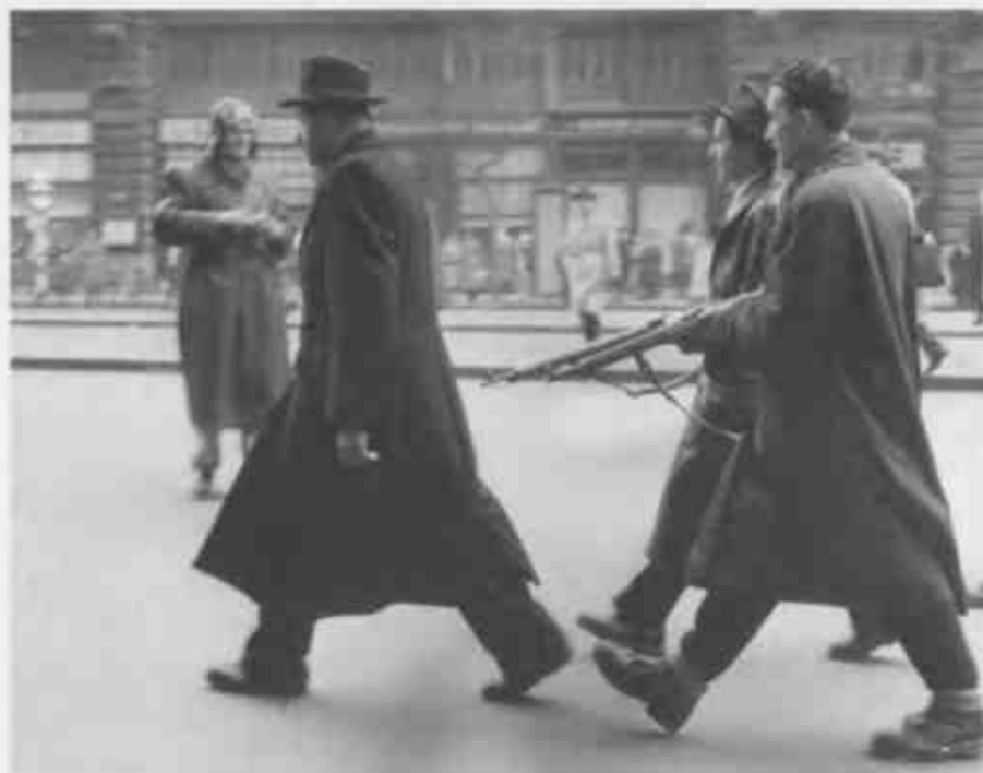
↑ Повстанцы конвоируют сотрудника министерства госбезопасности Венгрии AVH (Будапешт, конец октября 1956 г.).