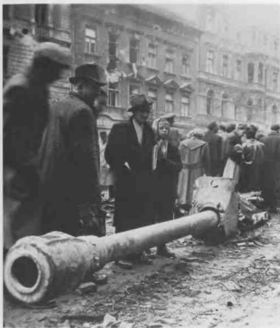
↑ Жители Будапешта возле орудия подорванного советского танка (конец октября – начало ноября 1956 г.).

Недовольство населения Венгрии очень скоро сменилось раздражением и враждебностью по отношению к непрошеным гостям. На улицах Будапешта завязались ожесточенные бои. Танк в городе, словно волк в клетке, предельно уязвим. Не для боя в городе танк создан. Танку простор нужен. Жуков в 1945 году без толку сжег в Берлине две танковые армии. Уроки войны великому полководцу не пошли впрок: по его планам танки снова ворвались в огромный город. Они горели в Будапеште таким же ярким пламенем, как и в Берлине. А как только огонь добирается до снарядов, жуткий взрыв срывает башню. Башня Т-54 весит восемь с половиной тонн, башня ИС-3 — почти двенадцать. При взрыве боекомплекта башня летит прочь словно горячая сковородка, брошенная свирепой бабой через всю кухню.