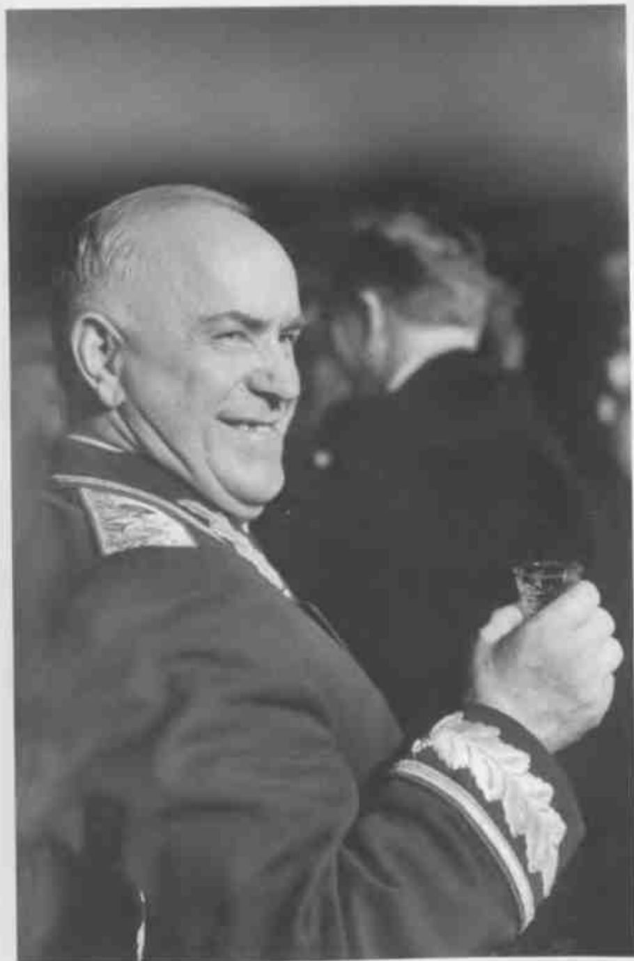
Министр обороны СССР Георгий Жуков на приеме в честь президента Югославии маршала Иосипа Броз Тито (июнь 1956 г.).