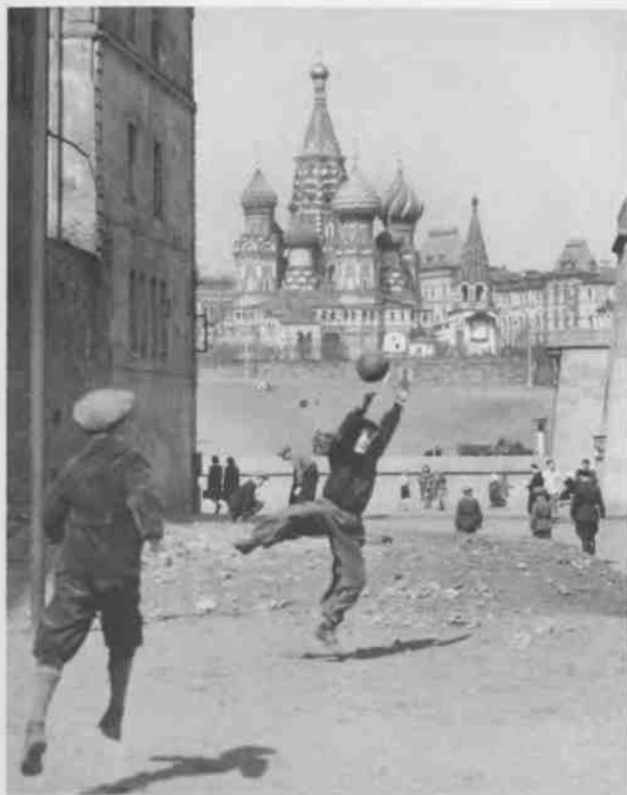
Игра в футбол. Москва, 1958 г.

В ту ночь в Москве прошел небывалый по силе проливной дождь. Противники Хрущёва совещались под зонтиками. Жуков им и вмазал: вот он, заговор! Я вас разоблачил!