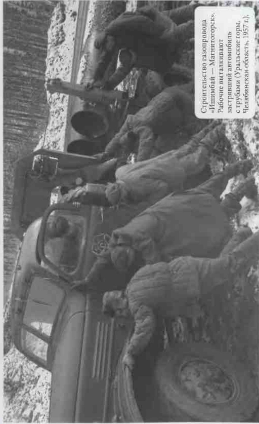
Строительство газопровода «Ишимбай — Магнитогорск». Рабочие вытаскивают застрявший автомобиль с трубами (Уральские горы, Челябинская область, 1957 г.).